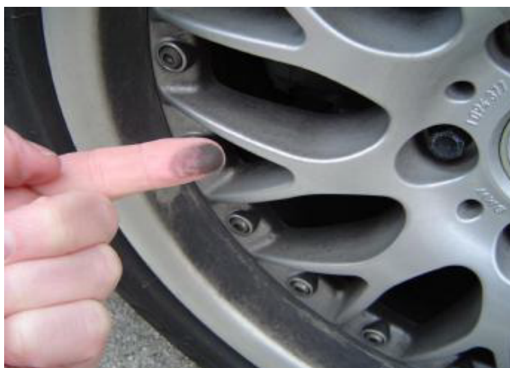
غبار سیاه کنار دیسک لنت غیر آزیستی

دامنه ای از ترکیبات معمول که هم اکنون در تولید مواد اصطکاکی به کار می رود شامل موارد زیر است.