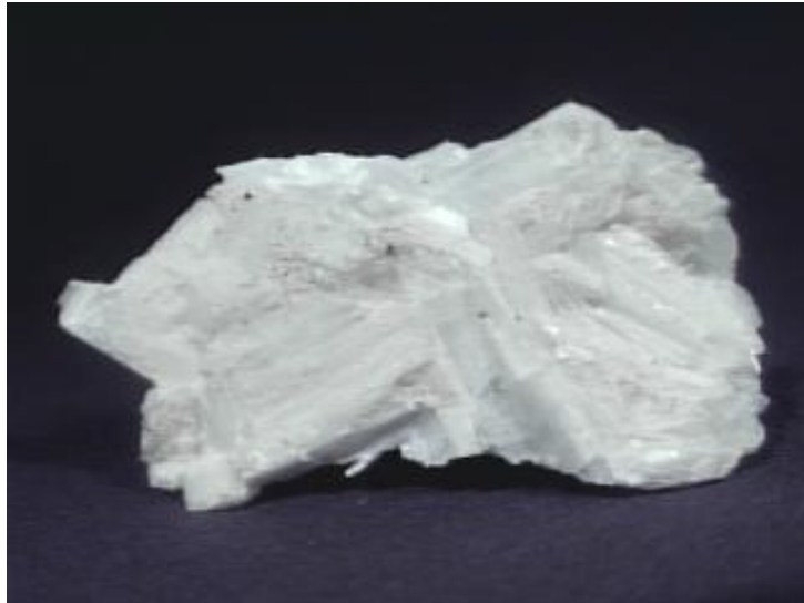
تصویری از ماده معدنی وولاستونیت

استفاده از وولاستونیت به عنوان جایگزینی برای آزبست کریزوتایل اگر از لحاظ اندازه الیاف درشت تر باشد به طور بالقوه می تواند مواجهه با الیاف را کاهش دهد. با این حال انتظار می رود که فایده اصلی حاصل از این ماده در کاهش ابقای زیستی آن باشد که منجر به کاهش بار ریوی در مواجهات قابل مقایسه می شود. شاید به این دلیل وولاستونیت از کریزوتایل کمتر سمی است و هر چند استفاده نادرست از مواد نصب شده می تواند به مواجهات بالای گذرا شود، مواد ته نشین شده به سرعت از ریه پاک می شوند. عوامل مؤثر در مشخصه محصول، محدوده اندازه و آلودگی سیلیسی می باشد.